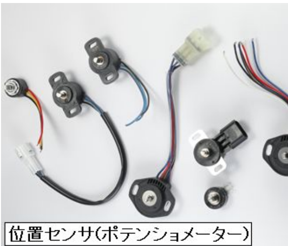
位置センサ(ポテンシオメータ)