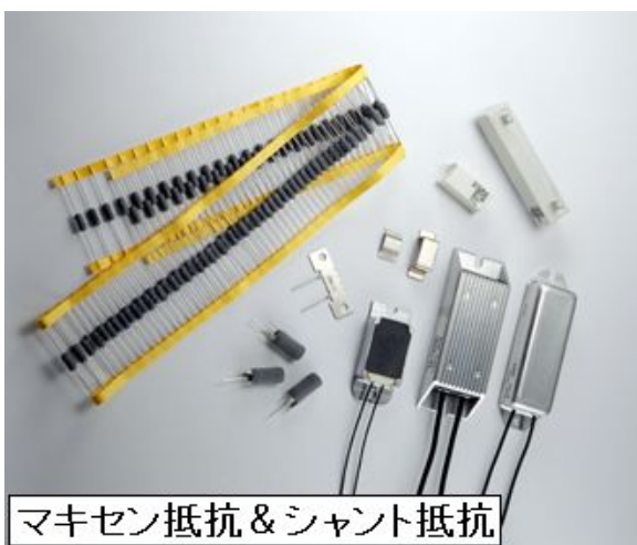
マキセン抵抗 & シャント抵抗