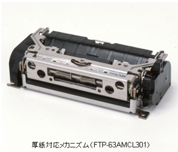
厚紙対応メカニズム(FTP-63AMCL301)