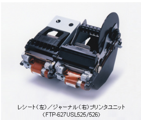
レシート(左)/ジャーナル(右)プリンタユニット (FTP-627USL525/526)