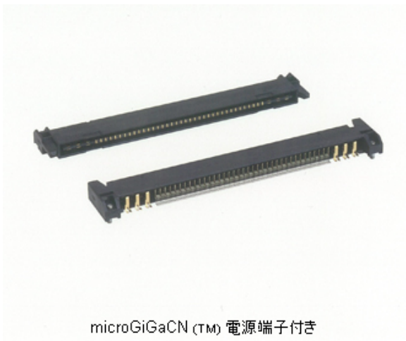
microGiGaCN (TM) 電源端子付き