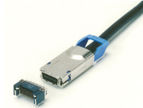
microGiGaCN (TM) I/Oコネクタ