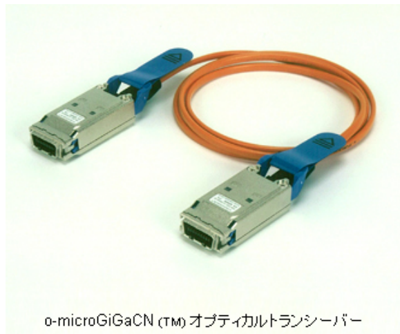
o-microGiGaCN (TM) オプティカルトランシーバー