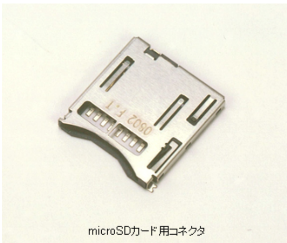
microSDカード用コネクタ