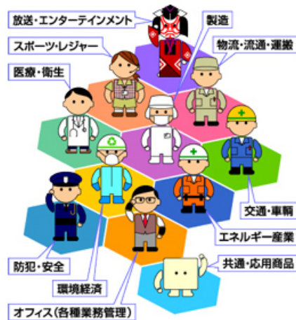
各分野にひろがる富士アイティの製品・ソリューション

電機メーカーとして80年以上の歴史を持つ富士電機グループ。当社はそのDNAを受け継ぎ、この世にマイコンやパソコンが誕生した時代から、多様なシステムやソフトウェア開発に取り組んできました。その核となっているのが、「情報技術」「制御技術」「エンベデッド（組み込み）技術」です。豊富な経験と実績を基にこれらの技術に日々磨きをかけ、さらに、これらをネットワーク技術とインテグレーション技術で融合し、お客様の課題解決に貢献します。